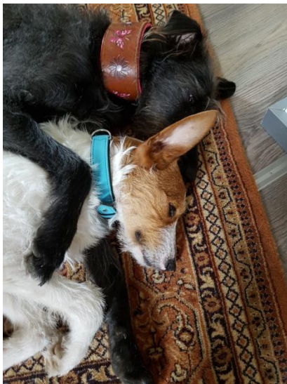
Vorne das bin ich, hinter mir Vicenta