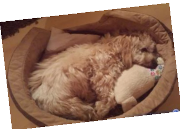
Ein Mittagschläfchen muss auch mal sein.