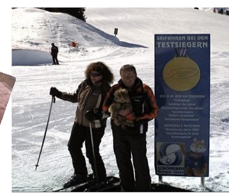
4 Wochen später im Skiurlaub, soviel Schnee hatte ich noch nie gesehen, es war ganz toll.