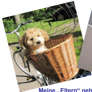
Meine „Eltern“ nehmen mich überall mit, hier waren wir in Zingst an der Ostsee, Rad fahren macht mir nicht soviel Spaß aber dafür gefiel mir das Baden in der Ostsee