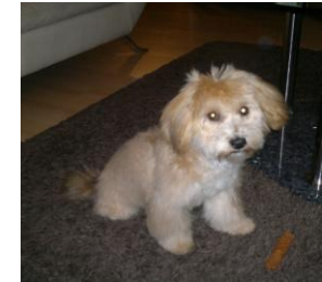
Nach meinem 1. Frisörbesuch war ich total geschafft, meinem Frauchen gefiel die neue Frisur nicht so gut.