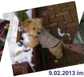
9.02.2013 im Garten meines neuen zu Hause. Der erste Eindruck gefällt mir sehr.