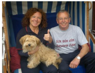
Wir „3“ im Strandkorb auf unserer Terrasse, dies ist mein Lieblingsplatz, von da habe ich einen super Blick auf die Straße.