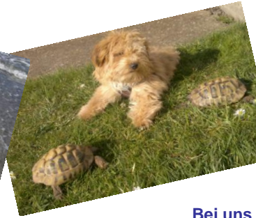
Bei uns im Garten, mit den Schildkröten Bonny und Ronny und meinem Swimmingpool.