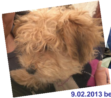
9.02.2013 bei meiner Ankunft in Holzgerlingen auf dem Arm von meinem zukünftigen Herrchen